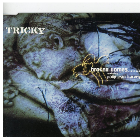
"Broken homes", l'album de Tricky

Elle retravaille sa voix afin de se fondre dans l'atmosphère désabusée du disque.