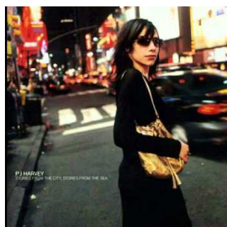
PJ Harvey & Tom Yorke : "This Mess We're In"

Il n'en faut pas plus à la chanteuse pour être la première femme à rafler un Mercury Prize , récompense annuelle qui consacre le meilleur album anglais de l'année.