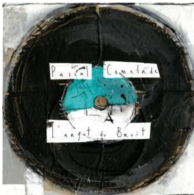
L'Album "L'argot du Bruit"

En 2016, le chanteur et pianiste français réédite L'Argot du bruit , initialement paru en 1998. Il décide de remanier l'album en réenregistrant plusieurs de ses titres. Fan de la voix de PJ Harvey, il l'invite à chanter en duo sur le titre inédit « Featherhead ». L'Anglaise collabore également à l'écriture des titres « Love Too Soon » et « Green Eyes », sur lesquels elle pose sa voix.